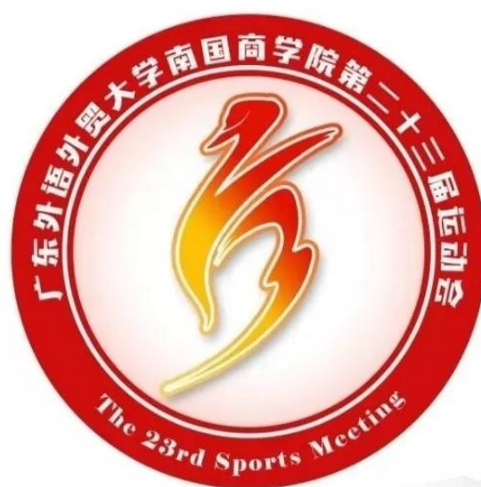
示例：第二十三届校运会会徽“青春如火”

性都深深地烙印其上。本次会徽的设计应突显校运会主题和南国校园文化，简洁深刻，遵循独特性、注目性、通俗性、文化性、艺术性等原则。“独特性”即简明突出、个性鲜明、与众不同，“注目性”即结构合理、对比清晰、视觉冲击力强，“通俗性”即易于识别、记忆和传播，“文化性”即显现民族传统、时代特色、社会风尚、校园特色，“艺术性”即优美的形式与深刻的寓意有机结合。