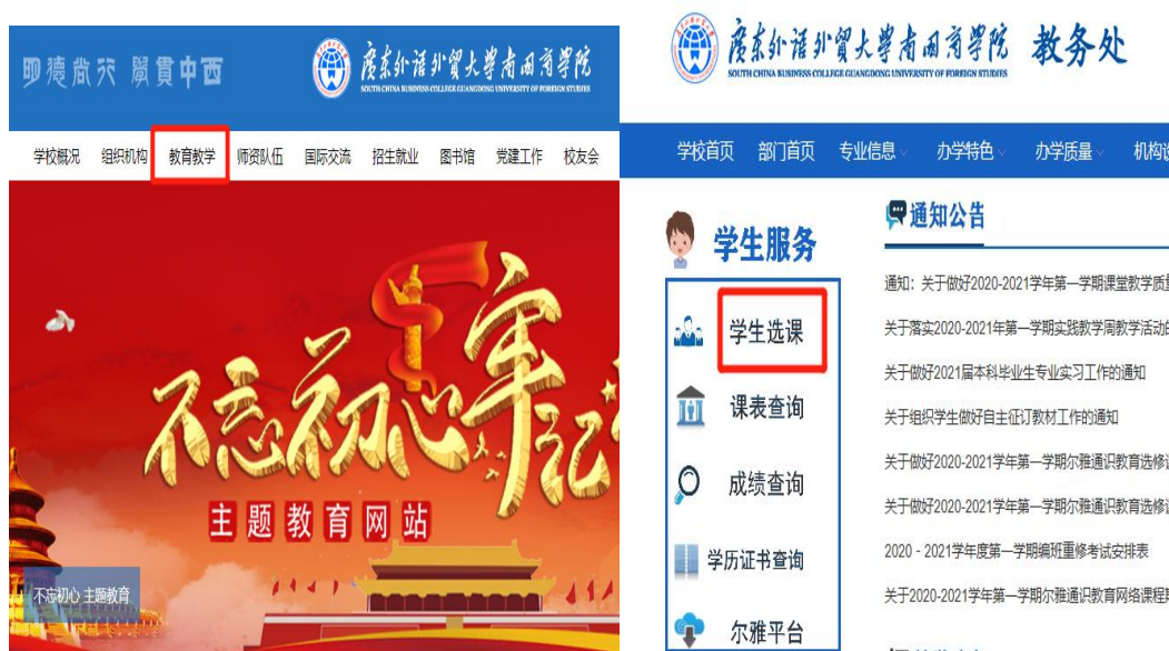
图 1 快速链接

方式二：学生访问“学校官网”→“教育教学”（教务处网站）→左边“学生服务”模块→“学生选课”。（见图 1）