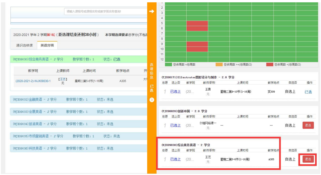
(图 6 选课查询及退选)

4.选择图 5 中 2 箭头所指橙色区域【选课信息】会展展开图 6 所示的界面，可查询已选课程及【退选】。