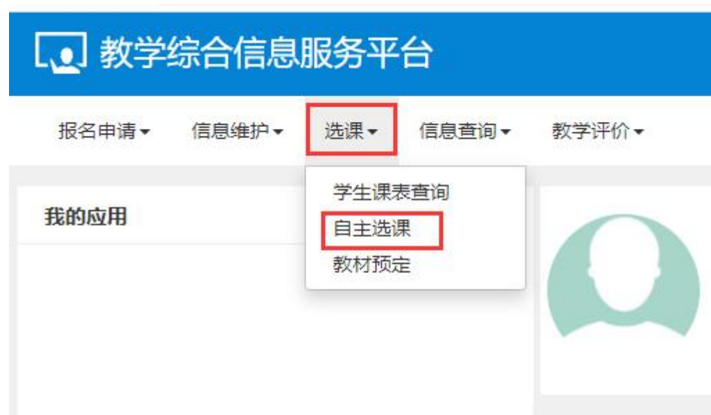
图 3 自主选课