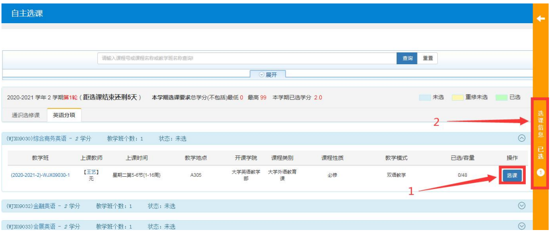
(图 5 选择课程)

4.选择图 5 中 2 箭头所指橙色区域【选课信息】会展展开图 6 所示的界面，可查询已选课程及【退选】。