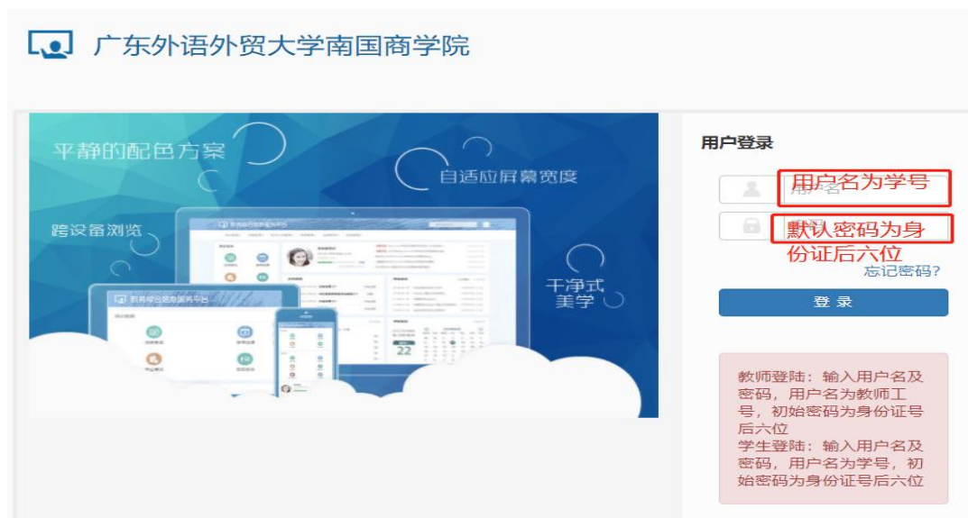
图 2 新教务系统登陆界面